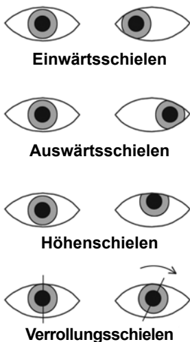
Abb. 2: Die unterschiedlichen Formen des Schielens:

tig, beobachtet man meist ein wechselseitiges („alternierendes“), also zwischen dem linken und rechten Auge abwechselndes Schielen.