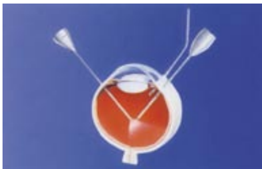
Abb. 5 Schema-Zeichnung der Vitrektomie

erfolgversprechende Behandlungsoption darstellen. Dabei werden Medikamente, wie Kortisonabkömmlinge oder VEGF-Inhibitoren, die gefäßabdichtend wirken, verwendet. Die Injektionen erfolgen ambulant unter lokaler Tropfbetäubung des Auges in einem sterilen Eingriffsraum. Mehrfache Wiederholungen des Eingriffes in monatlichem Abstand sind in der Regel für ein Abschwellen des Ödems erforderlich und regelmäßige Kontrolluntersuchungen sind daher Behandlungsvoraussetzung. Auch eine Kombination aus Laserbehandlung und Medikamenteneingabe in das Auge kann gelegentlich sinnvoll sein. Wenn in der Schichtdarstellung der Makula (OCT) festgestellt wird, dass ein Zug des Glaskörpers (Traktion) auf die Netzhautmitte das