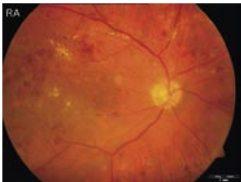
Abb. 2 Nicht-proliferative diabetische Retinopathie

(harte Exsudate) und Veränderungen der Venen. Zu diesem Zeitpunkt bemerkt der Patient häufig noch keine Beeinträchtigung seiner Sehkraft.