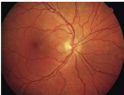
Abb. 1 Gesunde Netzhaut