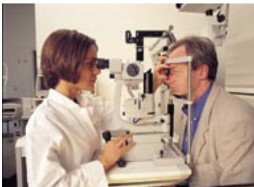
Abb. 4 Netzhautuntersuchung an der Spaltlampe

härentomographie (OCT) verwendet, bei der mittels moderner Kameratechnik eine 3-dimensionale hochauflösende Schicht-Darstellung der Makula erzeugt wird. Diese nicht invasive Untersuchungsmethode erlaubt es, sogar einzelne Netzhautzellschichten genau zu beurteilen. Durch wiederholte Untersuchung mit Vermessung der Makula ist so ein Therapieerfolg exakt einschätzbar und die Notwendigkeit neuerlicher Therapie bei Rückkehr des Ödems frühzeitig erkennbar, bevor es zu einem Sehverlust kommt. Solange die OCT-Untersuchung noch nicht als Kassenleistung abrechenbar ist, handelt es sich hierbei um eine sogenannte individuelle Gesundheitsleistung („IGeL“), deren Kosten der Patient selbst tragen muss.